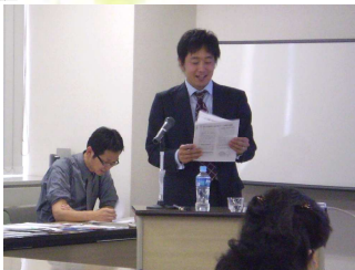
みなと元町セミナーにて

GW はみなさんどうやって過ごす予定ですか？ 神戸付近ではいろんなイベントが開催されますから、下調べして足を運んでみてはいかがでしょうか？神戸まつりもありますし。私は安くなった高速度道路を使って和歌山に帰省しようと思っています。多分渋滞に巻き込まれますが・・・。どこに行っても混み合いますから、事故のないように注意して楽しんでください。