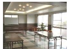
会議・研修に使用