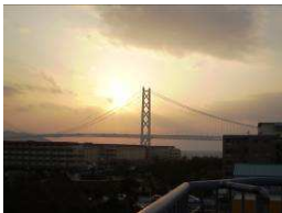
部屋から見える明石海峡大橋