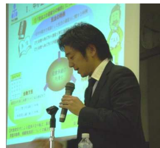
11月の事務所セミナーにて

先日、21年ぶりの中学校の同窓会に参加しました。皆それぞれちゃんとした大人になっており、とても懐かしく、楽しい時間を過ごしました。ちょっと飲みすぎて最後のほうは覚えていませんが…。忘年会シーズンです。皆さんも飲みすぎには注意しましょう。