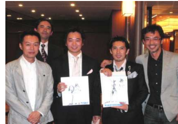
神戸ナインクルーズ設立パーティーにて

11月も事務所セミナーをはじめ、各地でいろんな勉強会などを企画していますので、お時間ありましたら是非ご参加いただき、いろんなネットワークを作っていただければと思います。