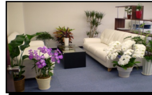
事務所は花屋さん状態です(笑)

平成19年6月11日に「みなと元町会計事務所」を開設しました。オープンの日からたくさんの方々がお花や植物を持ってきて下さいました。本当にありがとうございました！！大切に育てていきます。近くまでお越しの際はお気軽にお立ち寄り下さい。